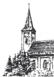
Stavern St. Michael